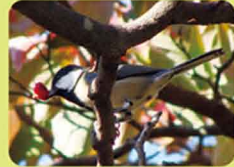
ハナミズキの実をくわえたシジウカラ

「実りの秋」というように、秋は多くの植物の実ができる季節です。新宿御苑でもハナミズキやムラサキシキブ、ドングリ(マテバシイ)などさまざまな果実が熟します。果実は都会で暮らす生きものたちにとって大切な食糧や住みかにもなり、生きものたちの命を支えています。秋の園内で生きものと果実のつながりを感じてみませんか。