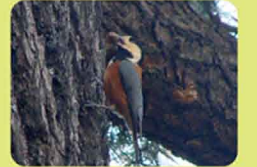
ドングリを木のすきまに隠すヤマガラ

※新宿御苑での動植物の採取・持ち込み及びエサやりは禁止されています。みなさまのご理解とご協力をお願い致します。