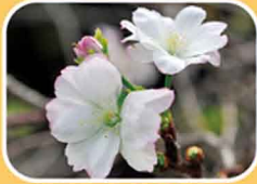
⑦ジュウガツザクラ