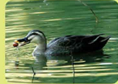
ドングリを食べるカルガモ